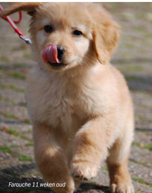
Farouche 11 weken oud

Op 28 oktober 2013 hebben we afscheid moeten nemen van onze trouwe Hovawart Banjer (Löwe Gasse). Banjer is ruim 11,5 jaar geworden en tot op de dag van zijn dood een mooie trotse zwarte reu.